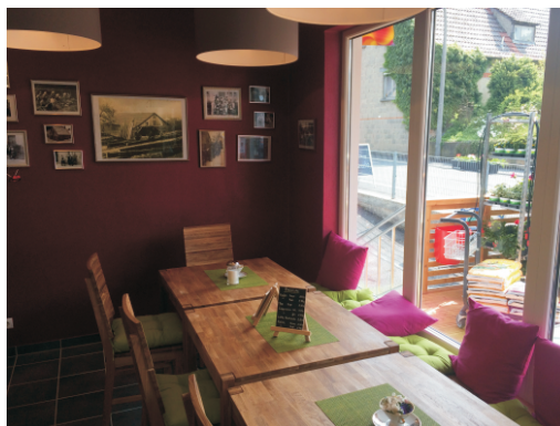
Igros Dorfladen Obersfeld

Der Wohlfühl-Faktor des Kunden steigt und führt automatisch zu höheren Gesamt-Umsätzen des Dorfladens.