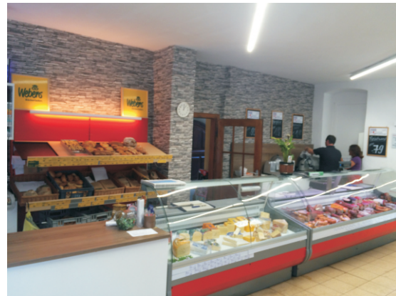
Igros Dorfaden Thüngersheim