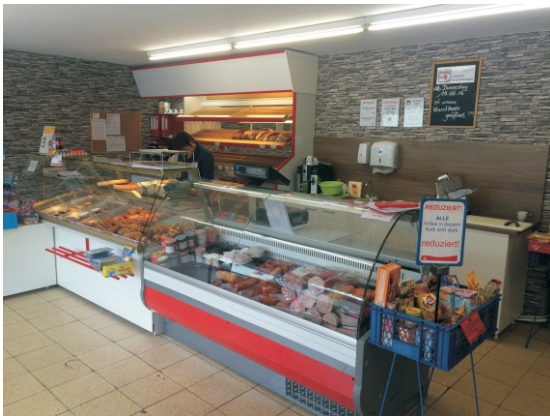
Igros Dorfaden Heustreu